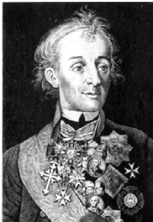
Александр Васильевич Суворов

Еще более славной была судьба Александра Васильевича Суворова. Из семидесяти лет своей жизни более пятидесяти он провёл в армии. Начал службу простым солдатом. Кончил её фельдмаршалом и генералиссимусом. Тридцать пять больших боёв и сражений провёл Суворов. В каждом из них он был победителем.