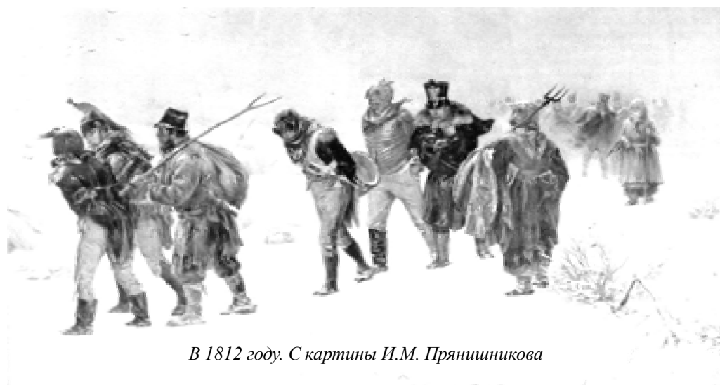
В 1812 году. С картины И.М. Прянишникова

— Бей до конца француза! Ныне это единый приказ. — Вот какая она, Василиса Кожина. Её хоть в губернаторы назначай, хоть в военный совет сажай.