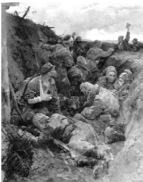
Декрет о мире.