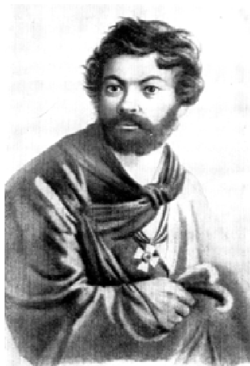
Денис Давыдов. Гравюра с рисунка А. Орловского

Фельдмаршал вскоре оценил мудрое предложение Давыдова, и сам стал отправлять отряды солдат в тыл к неприятелю.