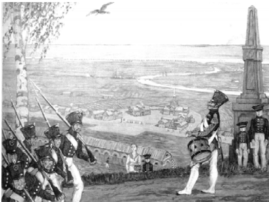
В военном поселении. С картины М. Добуженского

К достижениям поселений можно отнести лишь безукоризненную чистоту на улицах и в жилищах, а также стопроцентную грамотность поселян. Для них повсеместно были учреждены солдатские школы.