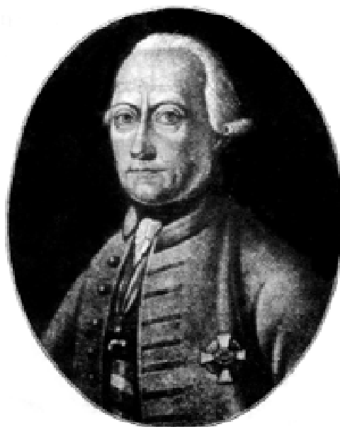
Борис (Мориц) Петрович Ласси. (1737-1820 годы).