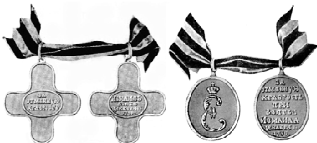
Офицерский крест за взятие Измаила.

Многие офицеры были награждены орденами, а те, кто не удостоился ордена, получили особой формы золотой крест на Георгиевской ленте с надписью «За отменную храбрость». Всем нижним чинам, участвовавшим в штурме, вручили серебряные медали на георгиевских лентах с надписью «За отменную храбрость при взятии Измаила декабря 11 дня 1790».