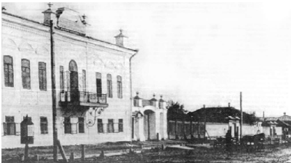
Здание Курганского суда.

на местах 1782 года. Были введены новые административные единицы - волости и их правление под названием “волостной суд”, который состоял из старосты и двух выборных заседателей с трехлетними полномочиями.