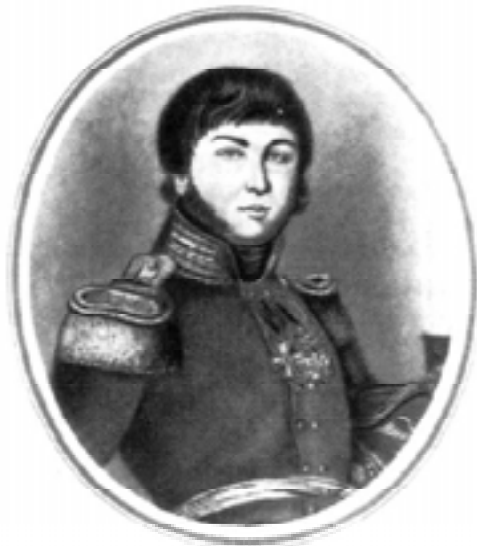
Александр Фигнер. Гравюра О.А. Кипренского

Как-то в какую-то итальянскую часть приехал из штаба Наполеона посыльный. Тут-то зашёл разговор и ещё об одном русском герое, о молодом штабс-капитане артиллерии Александре Самойловиче Фигнере.