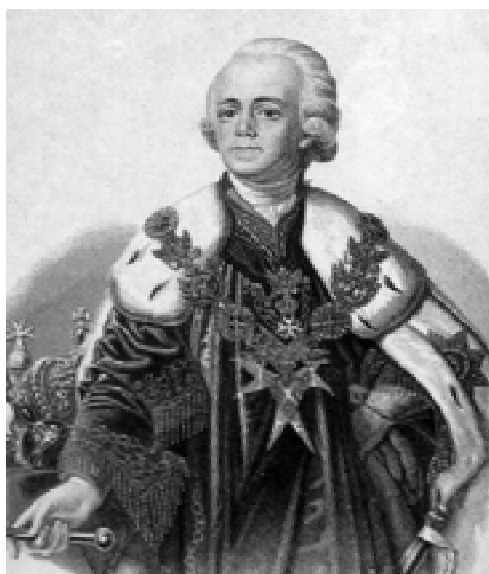
Император Павел I

В 1796 году императором России стал сын Екатерины II Павел I. Все описание периода его царствования (6.11.1796 -12.3.1801) рисуется черной краской и сводится к тому, что он был самодур, негодяй, издевался над людьми, карал за незначительные провинности или вовсе ни за что; все в его царствование было плохо. Но вот исторические факты:.