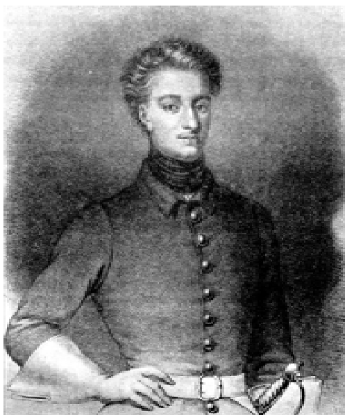
Карл XII, король шведский. 1682-1718 годы. С литографированного портрета Кардона (1835 год). Из собрания Румянцевского музея.

26 июня Карл XII объявил о наступлении и сказал своим генералам: «Завтра мы будем обедать в шатрах у московского царя. Нет нужды заботиться о продовольствии солдат: в московском обозе всего много припасено для нас.» Однако сделать свое нападение неожиданным шведам не удалось. Русские узнали о нем своевременно.