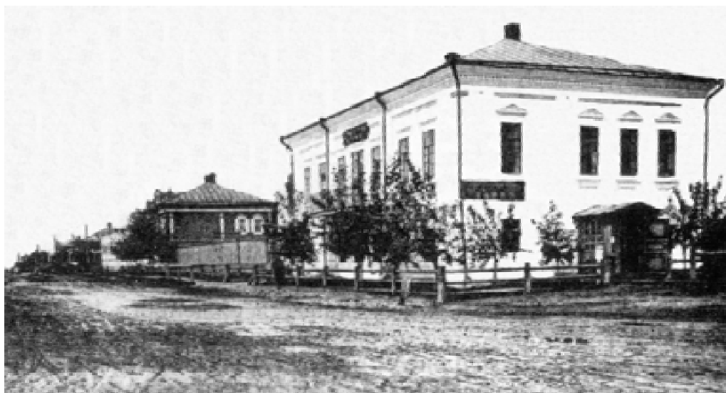
Здание Курганской думы и управы. 1880 год.

чивших образование, например, окончившие городские училища служили 3 года, начальные школы - 4 года. Обучение юношей явно поощрялось.