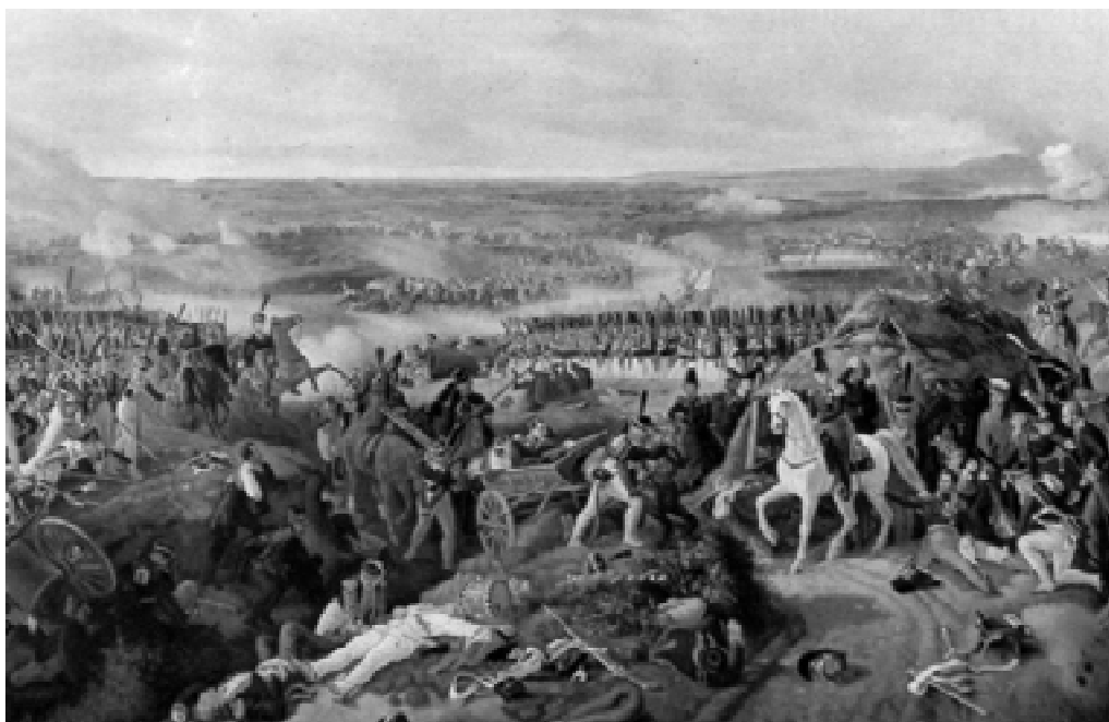
Сражение при Бородино. С картины П. Гесса

В трудные годы борьбы против иноземных захватчиков ярко проявился патриотизм зауральцев. Многим нашим землякам пришлось взяться за оружие, встать на защиту Родины от нашествия армии Наполеона, участвовать в разгроме захватчиков.