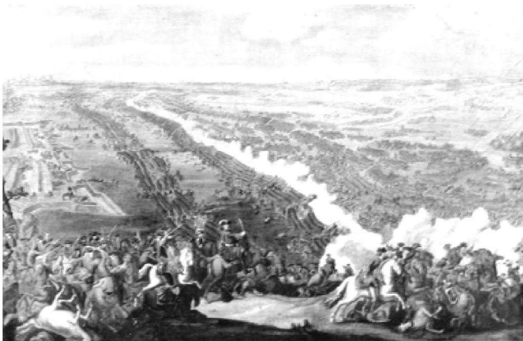
Полтавская битва. Фрагмент. С картины А. Е. Коцебу, 1867 год.

ванием полковника Нелина, да около двух с половиной тысяч вооруженных жителей, оказывали героическое сопротивление захватчикам, успешно отражая их многочисленные попытки ворваться в крепость. Осада надолго приковала к себе основные силы шведов, что дало возможность войскам Петра I беспрепятственно сосредоточиться поблизости от города.