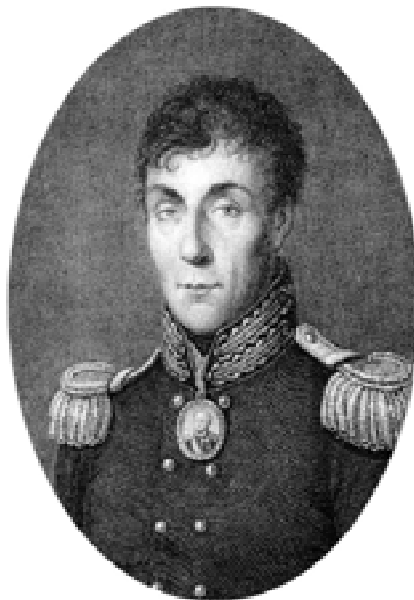
Граф Алексей Андреевич Аракчеев. Гравюра Н. Уткина.

Вводя военные поселения, правительство рассчитывало сократить рекрутские наборы, заменив рекрутов военными поселенцами. Еще накануне Отечественной войны, в целях дальнейшего накопления обученного резерва без увеличения расходов на армию, в 1810 году были созданы первые военные поселения. Они формировались из женатых солдат, прослуживших в армии не менее 6 лет, и местных жителей (мужчин) в возрасте от 18 до 45 лет. Жизнь военных поселенцев строго регламентировалась, они круглый год проходили военную подготовку. Сыновья военных поселенцев с 7 лет