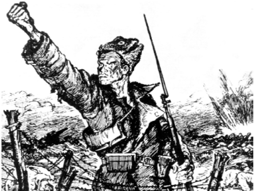
Проклятие империалистической войне. В. Щеглов.

Народ не хотел мириться с голодом, разрухой и войной. В феврале 1917 года произошла революция. Царь Николай II отрекся от престола, пришедшее к власти в России Временное правительство продолжило курс на ведение войны до победного конца. Но из-за нежелания солдат сражаться, самовольных уходов с позиций целых частей и общего развала армии войска потерпели ряд поражений. Русская армия катастрофически теряла свою боеспособность.