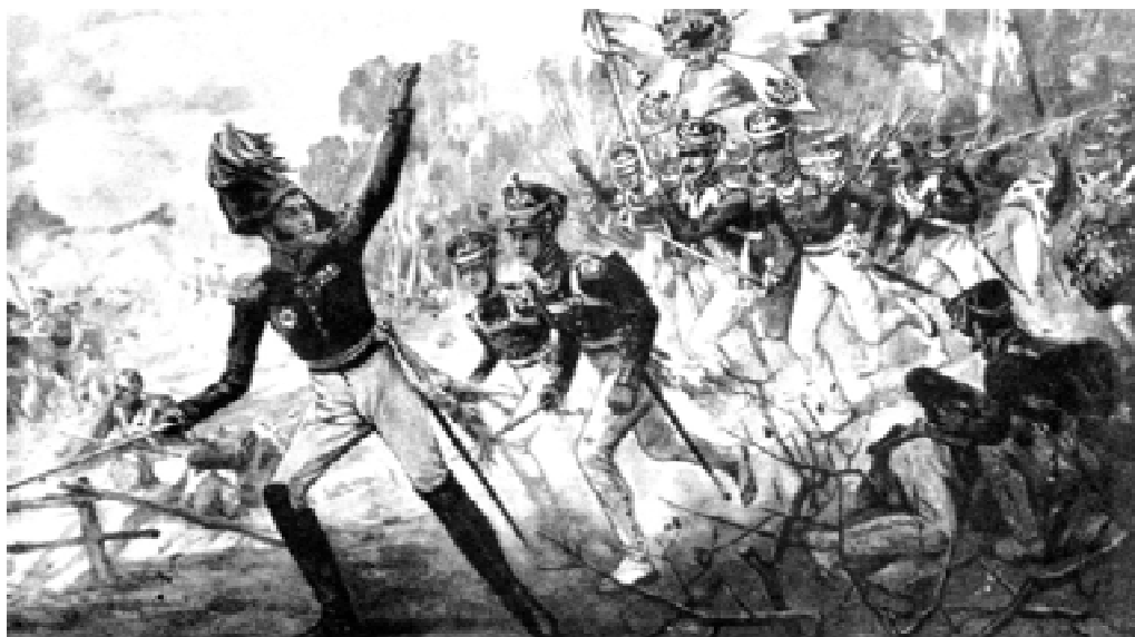
Подвиг солдат Раевского под Салтановкой. С картины Н. Самокиша.