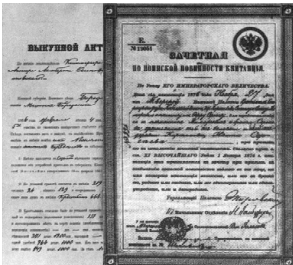
Документы по воинской повинности, 1876 год

Курганское окружное и Шадринское уездное по воинской повинности присутствия были образованы в 1874 году на базе уездных рекрутских присутствий и подчинялись, соответственно, Тобольскому и Пермскому губернаторам.