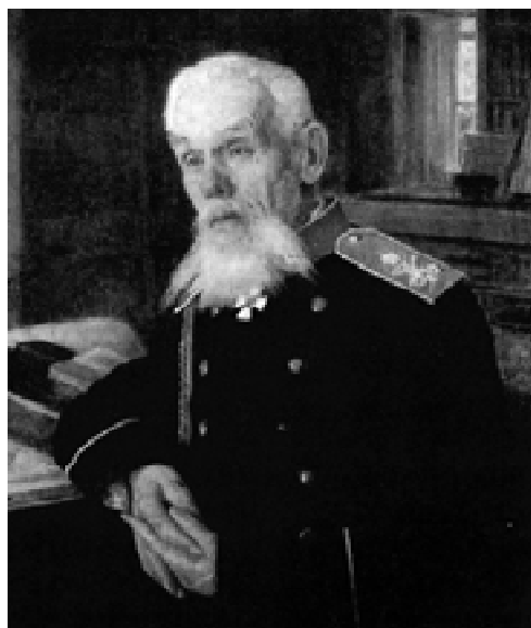
Дмитрий Алексеевич Милютин. Портрет работы П.Нерадовского.

Одновременно на местах были созданы военные округа. Вся территория России была разделена на 15 военных округов. Каждый округ являлся одновременно и органом строевого управления войсками и органом местного военно-административного устройства, сосредоточивая в себе все функции военного управления и представляя собой как бы военные министерства в местном масштабе.