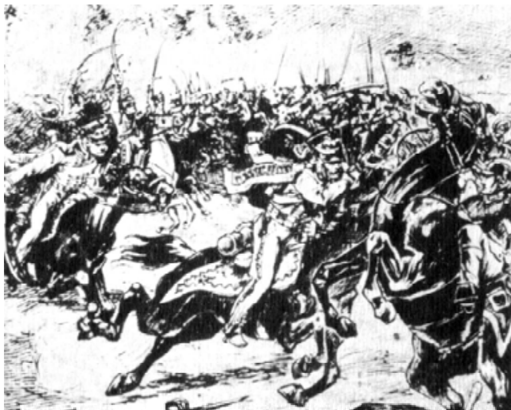
Бой под Островной. С картины Н.Самокиша

В начале Отечественной войны русские войска отступали, но солдаты храбро сражались за каждую пядь родной земли. Многим нашим землякам пришлось вступить в бой с неприятелем в это трудное время.