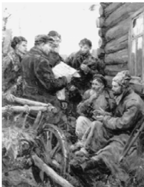
Декрет о земле.