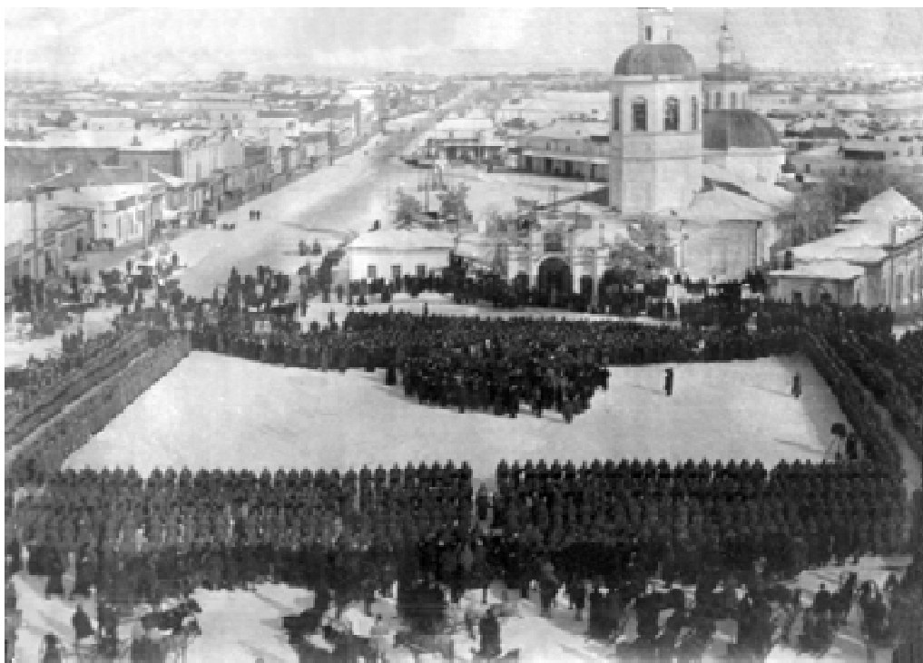
Пороводы на фронт. Город Курган. 1914 год. Из музея УВД.