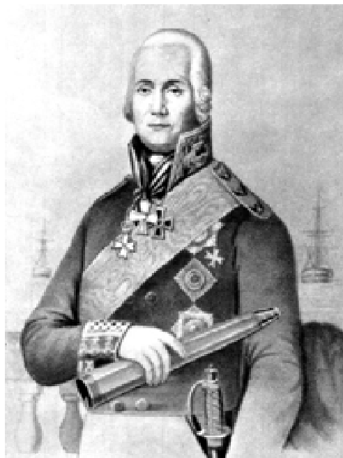
Федор Федорович Ушаков

На следующий день Ушаков возобновил преследование. Экипажи черноморских кораблей проявили высокое мастерство, смело и решительно атакуя противника, поражая его меткой орудийной стрельбой. Открывая огонь, Ушаков спешил сблизиться с противником. «Дистанция ружейного, даже пистолетного выстрела — и в картечь!» — таков был его обычный прием, приводивший врага в замешательство. В итоге — 7 турецких кораблей сдались, остальные спаслись бегством. Потери турок превысили 2 тысячи человек, у русских — 21 человек погиб и 25 ранено.