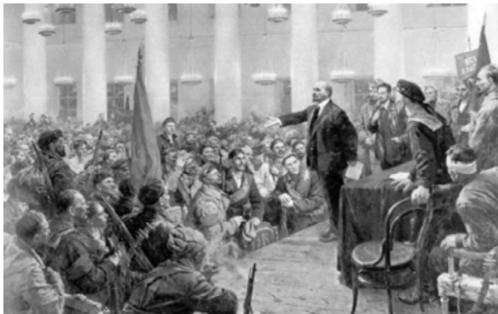
Выступление В.И.Ленина на II Всероссийском съезде Советов. В.А. Серов. 1955 год.

26 октября 1917 года Социалистическая революция победила. Одновременно в Смольном открылся 2-й Всероссийский съезд Советов. 26 октября его делегаты узнали о взятии Зимнего дворца и аресте членов Временного правительства.