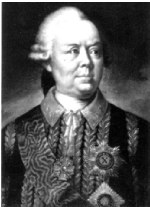
Петр Александрович Румянцев

Родился Румянцев в январе 1725 года. В 1740 году окончил сухопутный шляхетский корпус, подпоручик, поручик. 1741 год - июнь, капитан 1741 год - сентябрь, полковник 1743 год - июнь, генерал-майор 1755 год, генерал-поручик 1758 год, генерал-аншеф 1762 год, генерал-фельдмаршал 1770 год.