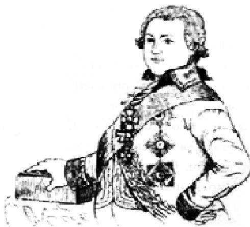
Осип Михайлович де Рибас, вице-адмирал. (1750-1800 годы) С гравированного портрета.