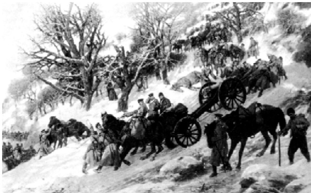
Через Балканы. С картины П.О. Ковалевского. 1880 г.