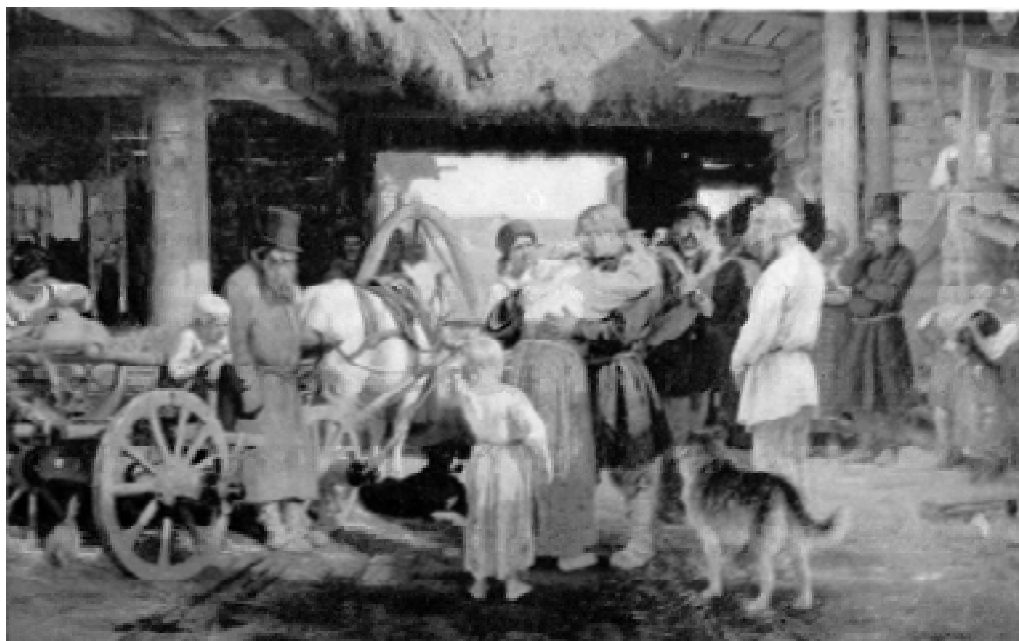
Проводы новобранца. С картины И.Е. Репина.