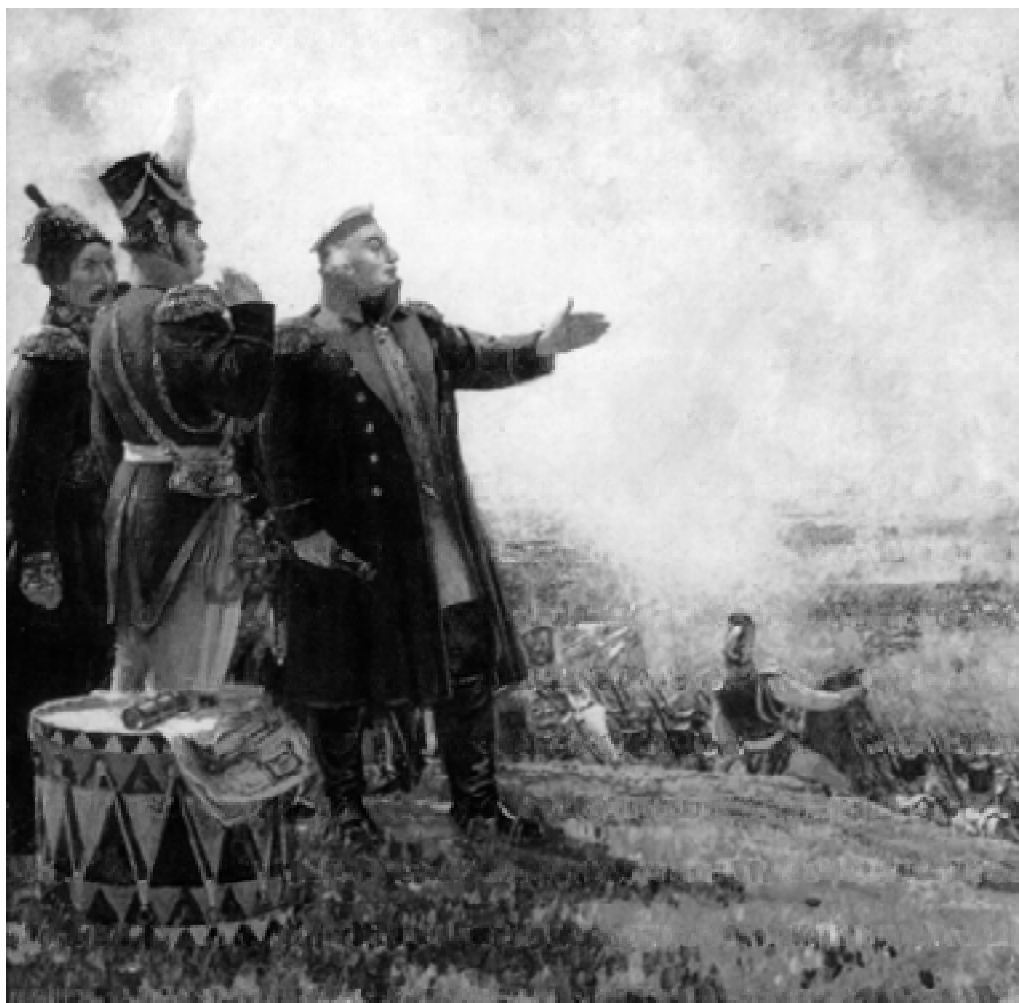
Михаил Илларионович Кутузов на Бородинском поле.