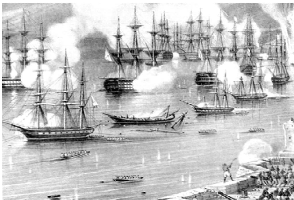
Синопское сражение. С картины А. Боголюбова.

На рассвете 18 (30) ноября 1853 года русская эскадра оказалась милях в десяти от Синопского рейда. В 9 часов утра Нахимов на корабле «Мария», Новосильский на 120-пушечном корабле «Париж», а за ними, в двух колоннах, остальные суда пошли к Синопу. В половине первого часа дня раздался первый залп турецких батарей по эскадре Нахимова, входившей на рейд. Флагманский корабль шел впереди и ближе всех стал к