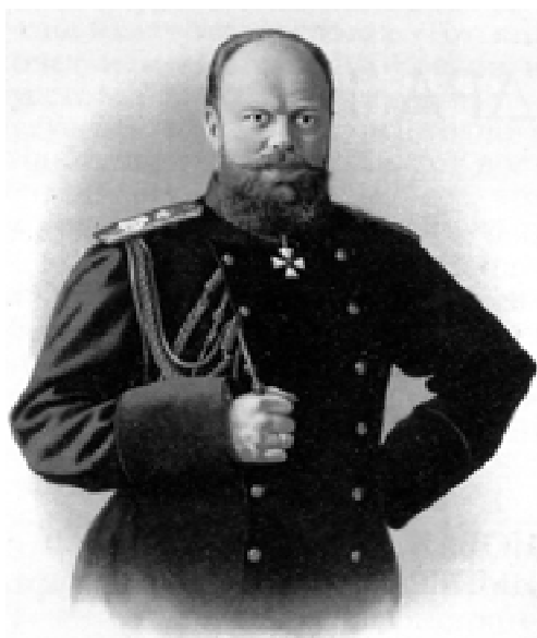
Император Александр III. Н. Борель. Хромофотография. 1895 год.

виях расстройств финансов Российской империи, усугубленного недавней войной на Балканах, недешево обошедшейся государственной казне. Поэтому на знамени военных нововведений крупными буквами было начертано слово «экономия», впервые появившееся в упомянутом Манифесте.