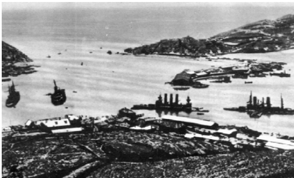
Порт-Артур. 1904 год.