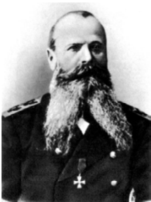
Степан Осипович Макаров.

вместе с ним ушли под воду, предпochтя смерть плену. Однако полностью разгромить русский флот японцам так и не удалось. Талантливый флотоводец вице-адмирал Степан Осипович Макаров сумел быстро восстановить боеспособность флота, поднять боевой дух моряков. Флот, готовясь к решительному сражению с врагом, несколько раз выходил в море, умело отражая минные атаки противника. Маленький крейсер «Новик» в одном из боев не побоялся один атаковать весь японский флот. Но с гибелью Макарова действия моряков ограничились лишь обороной Порт-Артура.